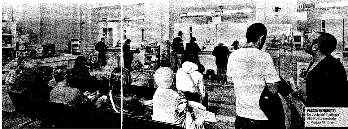
PIAZZA MINGHETTI Le code ieri in attesa alla Posta centrale di Piazza Minghetti

I FONDI I soldi che l'Istat ha girato al Comune per le spese del censimento